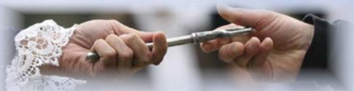
Kyrkjens nøkkelen er eit viktig symbol i spelet.